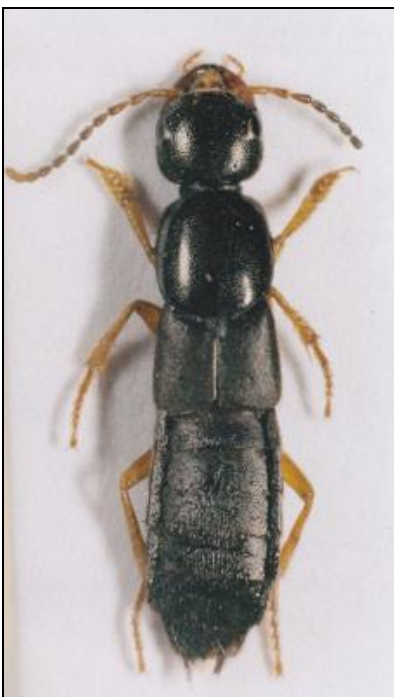
Fig. 1. Habitus de O. brunnipes (Fabr.)

Revisando la colección de Staphylinidae ibéricos del Museo de Ciències Naturals (Zoologia) de Barcelona, hemos encontrado dos ejemplares de Ocypus (Matidus) brunnipes brunnipes (Fabricius 1781) (figs. 1 y 2), especie no mencionada de la Península Ibérica en el catálogo iberobaleár de Staphylininae (Gamarrá y Outerelo 2008), por lo que aportamos las primeras citas de dicha especie para la Península Ibérica, de las provincias de Zaragoza y Lleida.