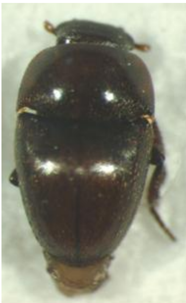
Fig. 1. - Habitus of Thorictus sulcicollis Pérez Arcas, 1868.

The genus Thorictus Germar, 1834 contains 160 species and subspecies worldwide, while only 11 species are known to occur in Spain (Háva 2007, 2010).