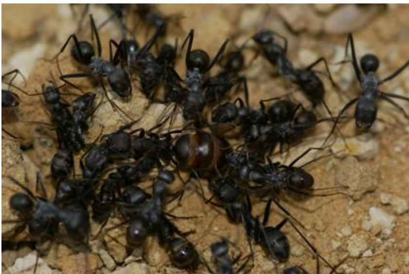
Fig. 4.- Cataglyphis hispanica (Emery, 1906), host ant.