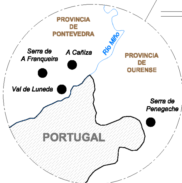
Mapa 1.- Localización de los lugares que se citan en este trabajo: