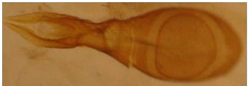
Fig. 4. - Edeago de Nudobius lentus (Gravenhorst, 1806).

Por estudios realizados en Francia, se ha comprobado su expansión por todas las regiones y hacia el sur (Coiffait, 1972; Soldati & Puissant, 2000). Lo mismo ocurre en Inglaterra (Alexander, 2002), donde se ha extendido mucho en los últimos años y ahora ocupa ya todo el sur de Inglaterra, donde Fowles et al. (1999) han establecido el índice SQI (Saproxylic Quality Index) que establece una evaluación de la calidad de los hábitats boscosos para la conservación de la biodiversidad asociada a la madera muerta empleando como indicadores la presencia o ausencia de algunas especies de coleópteros, entre los que se encuentra Nudobius lentus . La causa de estas expansiones recientes se debe a la proliferación en épocas pasadas de repoblaciones con coníferas, que han dado lugar a la presencia en la actualidad de bosques afectados por plagas o incendios.