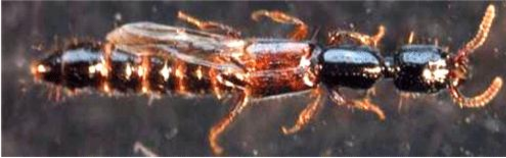
Fig. 3. - Ejemplar hembra de Nudobius lentus (Gravenhorst, 1806).

la mitad basal arqueada y la mitad distal recta y muy próximos entre sí. Lóbulo medio elipsoide y con válvula capsular circular (Fig. 4).