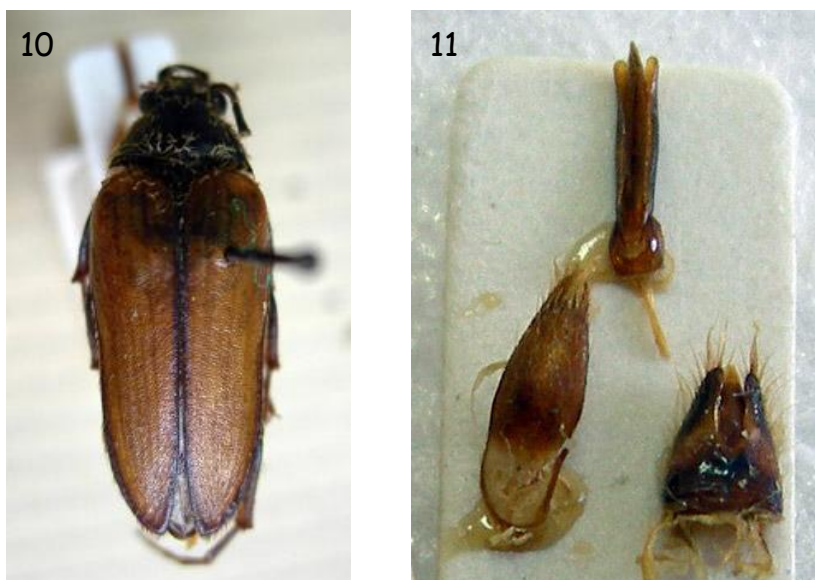
Figs. 10-11. - Cebrio seoanei Pérez Arcas, 1865 (ejemplares conservados en la col. Museo Nacional de Ciencias Naturales de Madrid). 10.- Habitus. 11.- Estructuras genitales del macho.