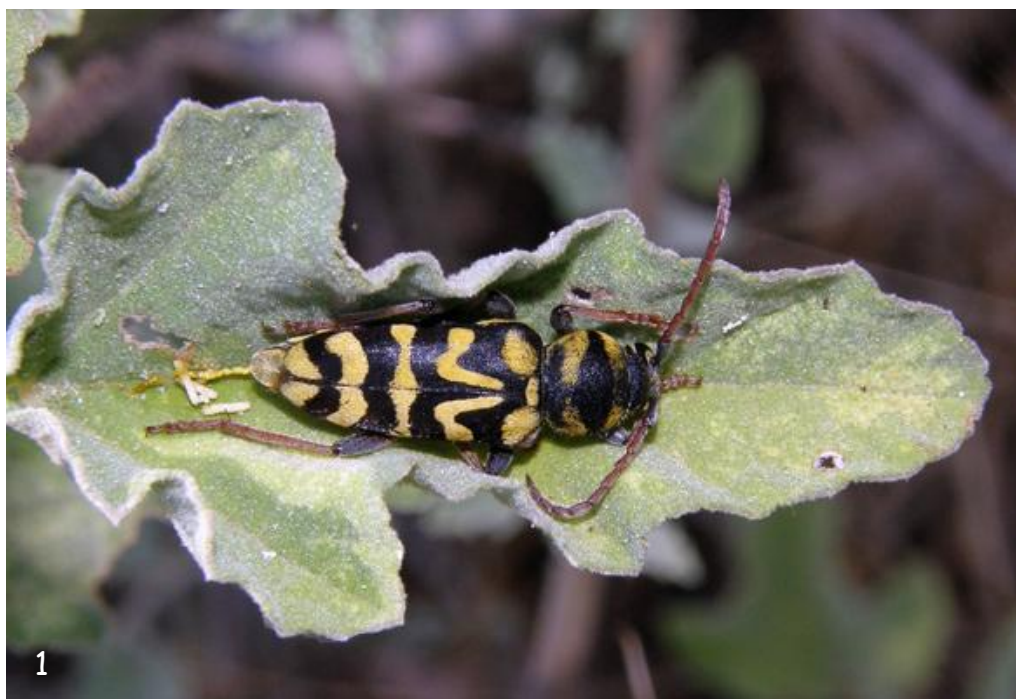
Fig. 1.- Ejemplar de Plagionotus andreui sobre una hoja de Lavatera olbia en la localidad de Odemira, Beja, Baixo Alentejo, Portugal (UTM: 29SNB33).

A partir de los registros bibliográficos y de los autores se representa la distribución de las especies L. triloba y L. olbia (Fig. 3) y el área de distribución potencial estimada de P. andreui .