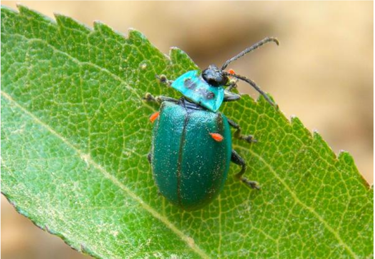
Fig. 2. - Vista dorsal de Aspicela nigroviridis.