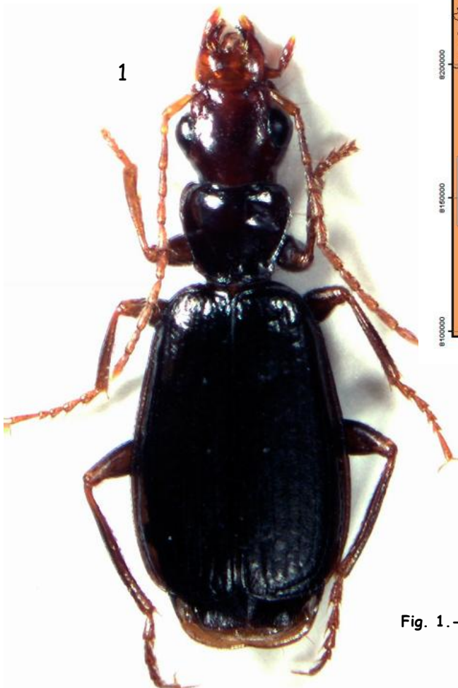
Fig. 1. - Mimodromius altus Liebke, 1941.