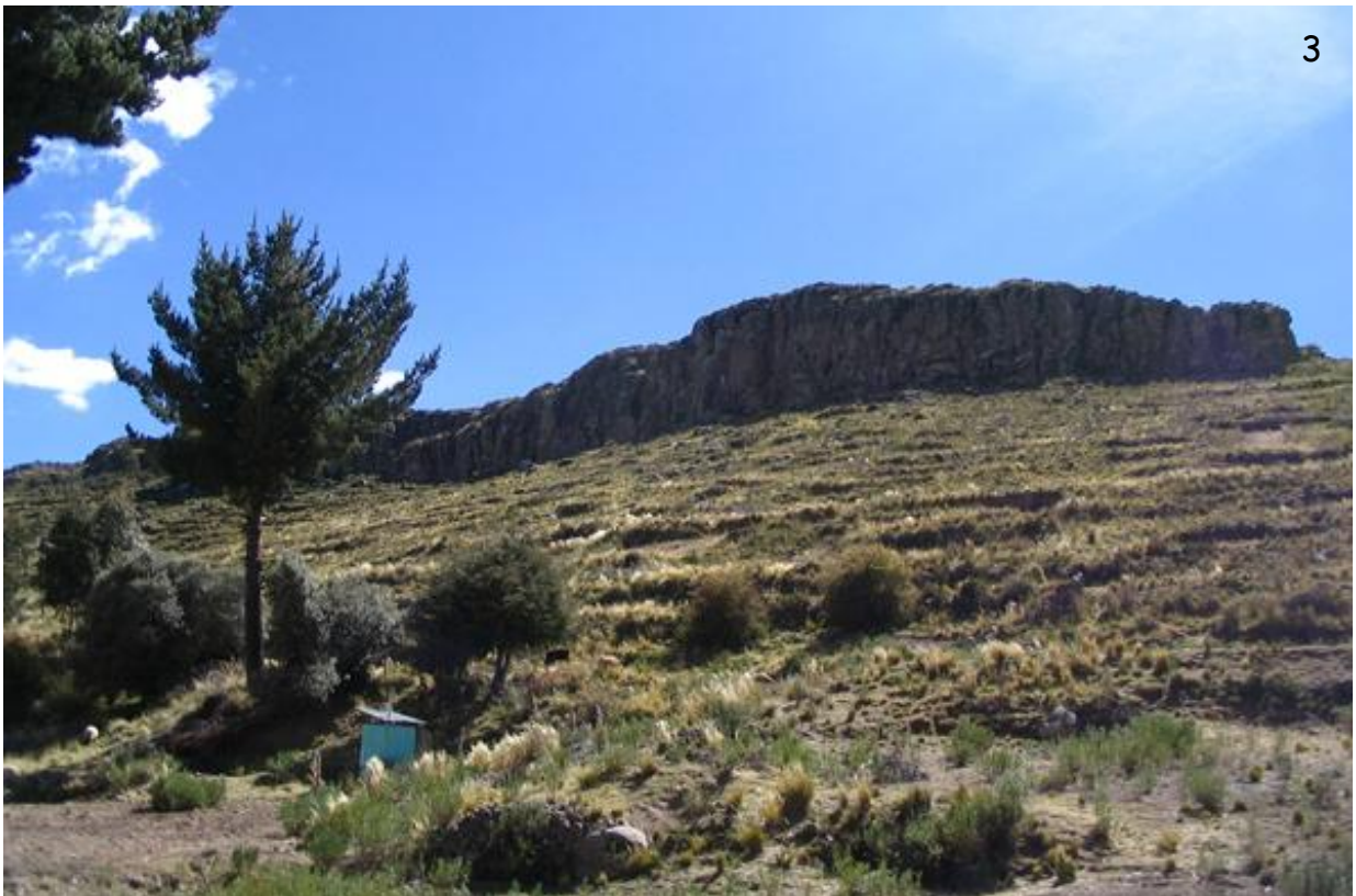
Fig. 2.- Aspecto de la localidad de Macaya Piripirini (Azángaro).