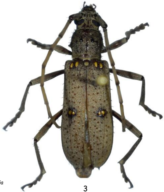
Fig. 3.- Habitus del adulto de Eburia porulosa (Bates, 1892).