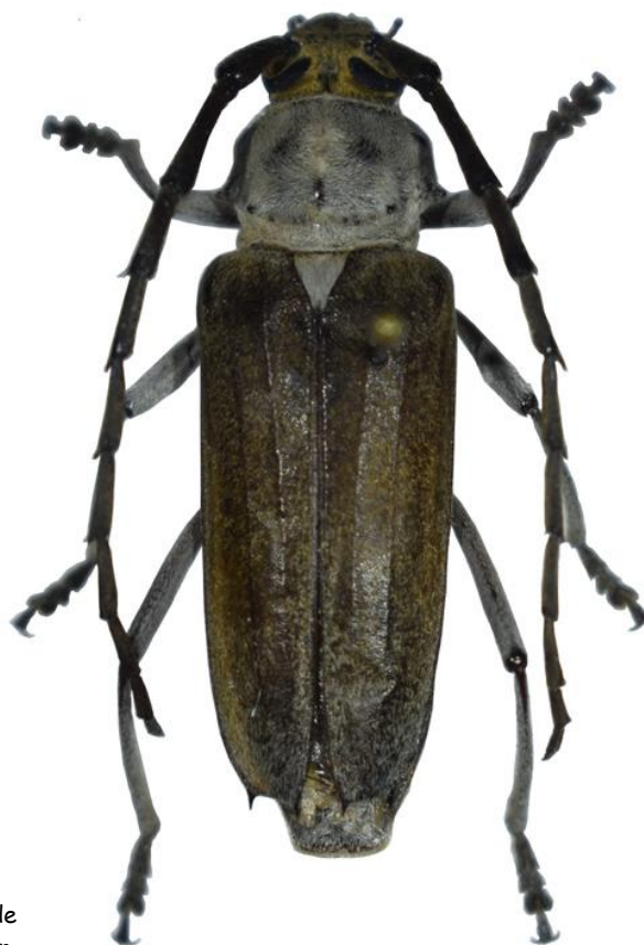
Fig. 1.- Habitus del adulto de Gnaphalodes trachyderoides (Thomson, 1861).

Svacha, P. & Lawrence, J. 2014. Cerambycidae Latreille, 1802 , pp. 77-177. In: Leschen, R.A.B. & Beutel, R.G. (eds). Handbook of Zoology, Arthropoda: Insecta; Coleoptera, Beetles, Volume 3: Morphology and systematics (Phytophaga) . Walter de Gruyter, Berlin/Boston. 687 pp.