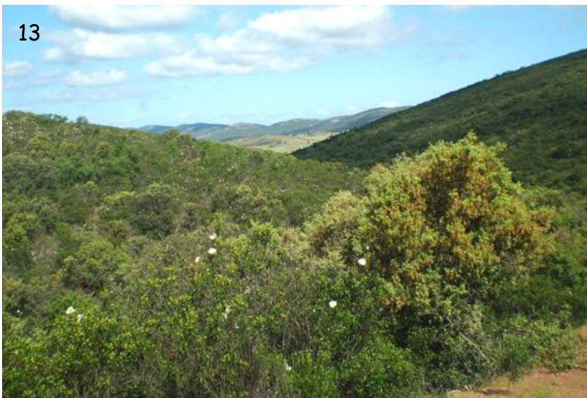
Fig. 13.- Entorno inmediato hacia el noreste. Encinares en muy buen estado de conservación de Quercus ilex susp ballota , con muchos quejigos y madroños ( Arbutus unedo L.) y matorral de jara pringosa ( Cistus ladanifer L.).