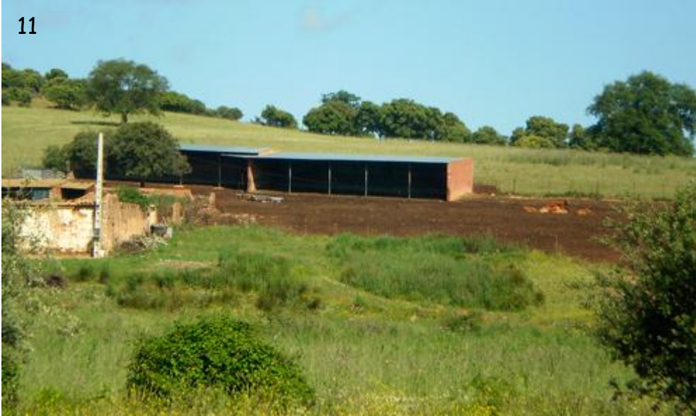
Fig. 11.- Lugar exacto, "Casas de Caracuel", en donde se colectó en sus tiempos este ejemplar de Bolbelasmus que ahora es Holotypus de Bolbelasmus casanovaorum n. sp. En este valle existen pequeñas explotaciones con cabras y ovejas y algunas vacas.