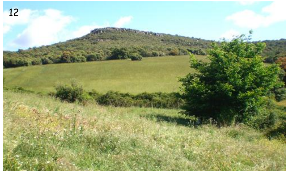
Fig. 12.- Entorno inmediato hacia el oeste. Cultivos extensivos de cereal (principalmente avena, pero también trigo y centeno); encinares de Quercus ilex L. subsp. ballota (Desf.) Samp. con bastante quejigo, Quercus faginea subsp. faginea Lam. y matorral de jara Cistus ladanifer y junto al arroyo, algunas olmedas ( Ulmus minor Mill.).