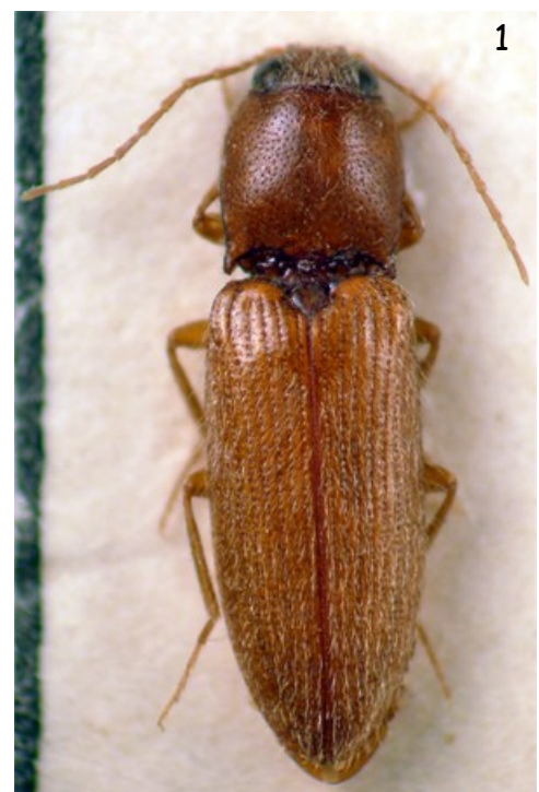
Fig. 1. - Habitus de Craspedostethus silesioides (Escalera, 1914).

Platia, G. 2012. Contribution to the knowledge of the click-beetles from the Socotra Island (Yemen) (Coleoptera Elateridae). Arquivos Entomológicos , 7 : 129-153.